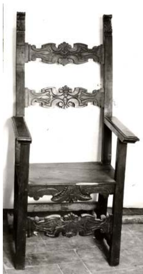
Intervento di restauro su una sedia del XVI secolo Laboratorio di restauro sotto la direzione del prof. Gianpiero Giuliani attualmente conservata nel Museo Statale di Palazzo Taglieschi, Anghiari