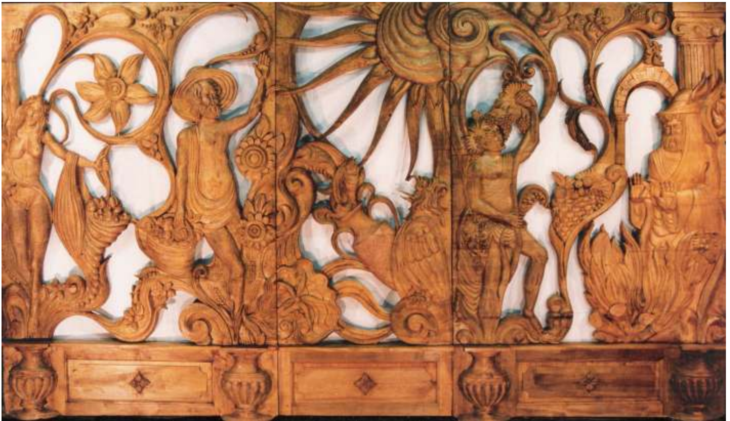
Frontone e fianco di camino intagliato ad alto , basso rilievo e con figure a tutto tondo Intaglio ad alto rilievo adibito a parete divisoria 400x200h x8 cm di spessore