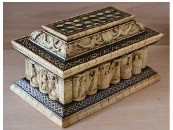
Restauro di cassone intarsiato alla certosina Venezia XV° secolo