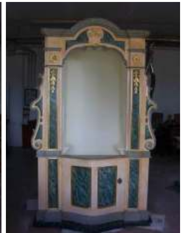
Restauro di una specchiera dorata Restauro di un capoletto intagliato e dorato Intervento di restauro di un confessionale laccato e dorato