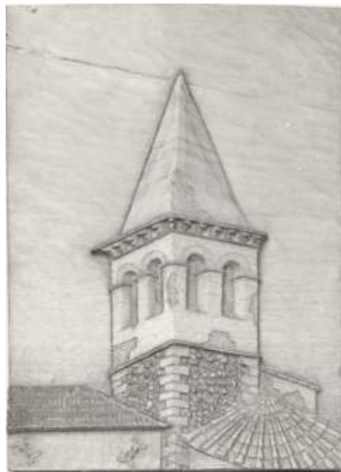
Elaborato intagliato copia filologica di applique del XVIII secolo - Basso rilievo intagliato su tavola di noce (Sant'Agostino) laboratorio di intaglio sotto la direzione del prof. Alfiero Coleschi